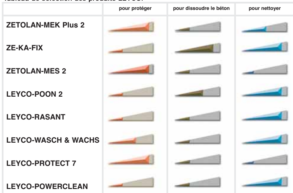
Tableau de sélection des produits LEYCO: