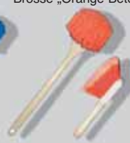
Brosse „Orange Betonac“