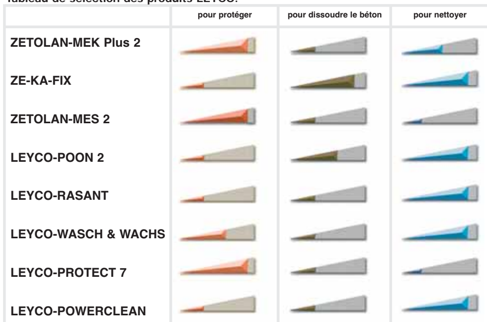
Tableau de sélection des produits LEYCO: